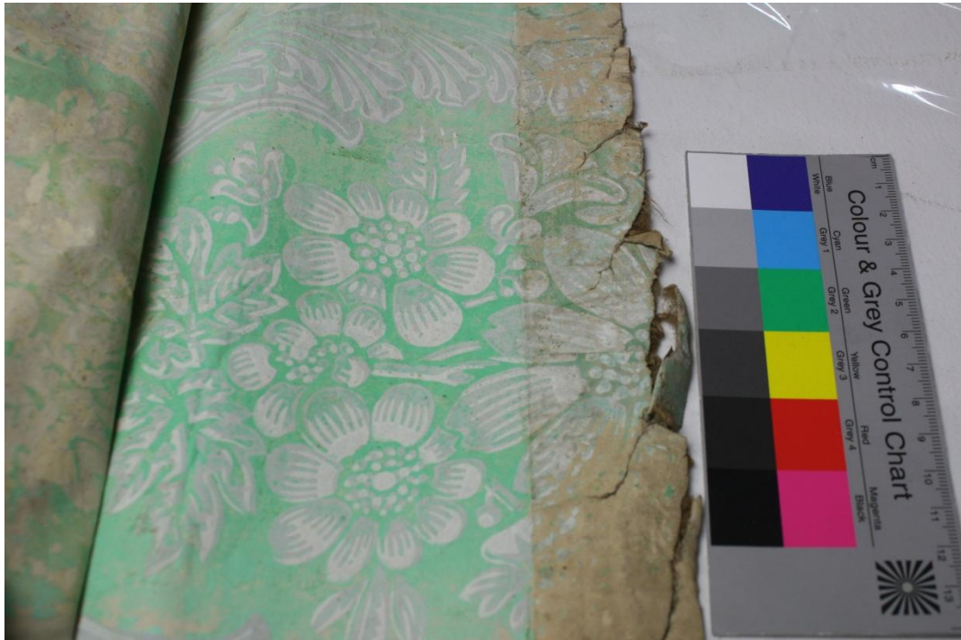
Abb.9: Pendant (Inv.Nr: 2010-22-C Fragment 1) zur Bordüre der Tapete 2010-22-B

Zusätzlich zu dem Abrieb der Druckschicht ist die Tapete sehr spröde und besonders am linken Rand überall eingerissen.