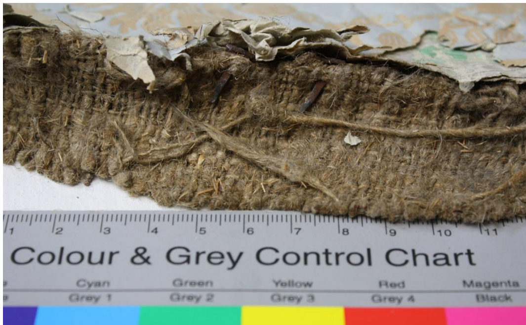
Abb.4: Eisennägel im Gewebe

In Abständen von etwa 2 cm finden sich am linken Rand beidseitig der Umschlagkante die Durchschlaglöcher der Nägel. Diese sind teilweise ausgefranst und zeigen Korrosionsspuren. Neun der Eisennägel befanden sich noch im Gewebe.