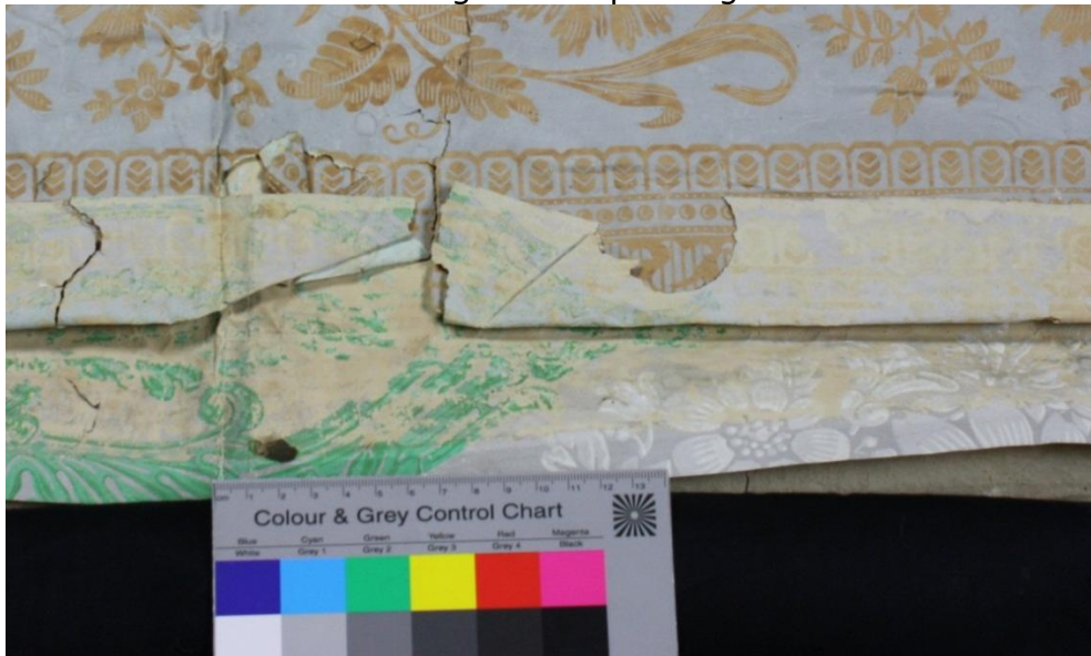
Abb.8: Abklatsch der unteren Druckschicht auf der Rückseite der oberen Tapete

Die erste Papiertapetenschicht ist besonders in ihrer Druckschicht schwer beschädigt. Große Mengen der Farbpigmente pudern ab oder sind an der Unterseite der überklebten Tapetenschicht haften geblieben. Darunter kommt das helle Braun-Beige des Papierträgers zum Vorschein.