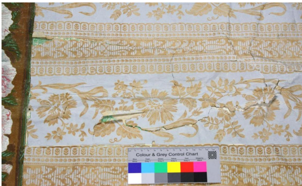
Abb.12: Riss im unteren mittleren Bereich der Tapete

Dreck- und Staubablagerungen ziehen sich über die gesamte Tapete und lassen die Farben verblassen. In der unteren Hälfte haben sich die Papierbahnen voneinander und vom Untergrund gelöst und die mittlere Bahn zeigt einen großen Riss, der die Gefahr birgt, das Teilstück könne ganz abgetrennt werden.