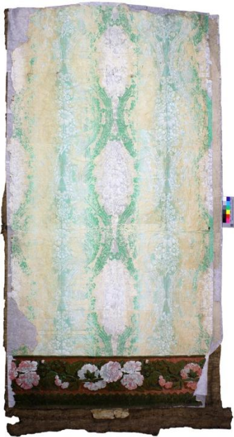
Abb.1: Gesamtansicht der freiliegenden Iristapete