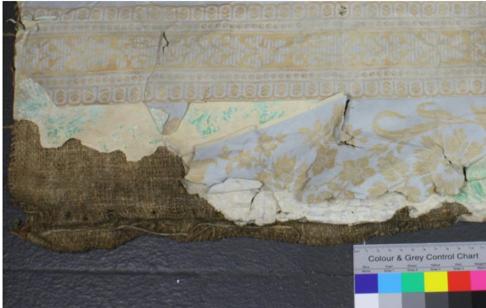
Abb.6: Verlust aller Papierschichten an der oberen linken Ecke

Das Makulaturpapier ist recht brüchig und besonders an den Rändern sehr zerknittert und rissig. Gerade die linke Seite ist extrem beansprucht. An der unteren sowie an der oberen linken Ecke zeigen sich zwei Verluststellen.