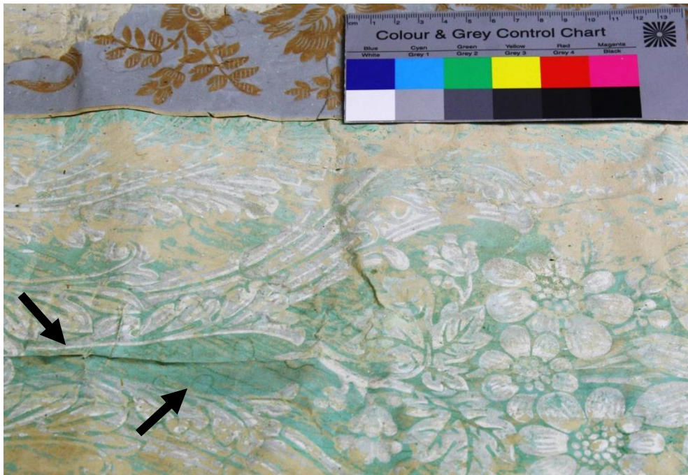
Abb.10: Klaffender Tapetenverbund und Wasserränder im mittleren Bereich der Tapete

Die Bordüre ist recht verschmutzt mit Staub und Holzsplittern aus dem Gewebe sowie abgepulverten Farbpartikeln von der Druckschicht. Außerdem ziehen sich vor allem über den unteren Bereich der Veloursbeschichtung weiße Spuren, bei denen es sich vermutlich um Schimmel handelt, die sich stellenweise aber auch am oberen Rand wieder finden.