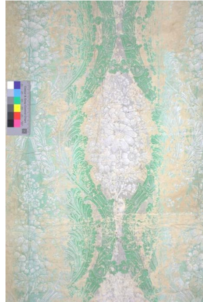
Abb.2: Nahaufnahme des Tapetenmusters

Das Muster der zweiten Druckschicht bildet die Blumenornamentik, die den genau umgekehrten Farbverlauf aufweist. Es verläuft ein helles Grau in ein kräftiges Grün und wieder zurück zum Grau.