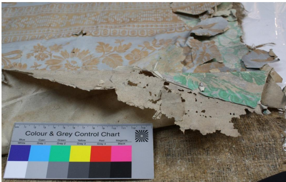
Abb.7: Silberfischchen Fraß an der oberen rechten Ecke

An der oberen rechten Ecke weist es ausgeprägten Silberfischfraß auf. Dieser zeigt sich durch die unregelmäßig angefressenen Papierränder und -löcher.