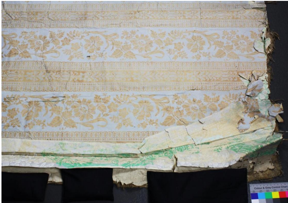
Abb.13: Knick entlang des linken Randes

Am rechten Rand zieht sich ein Knick durch die Tapete und alle ihre Schichten. Die oberste Tapete ist dadurch besonders beansprucht und hat entlang des Knicks Fehlstellen und Risse.