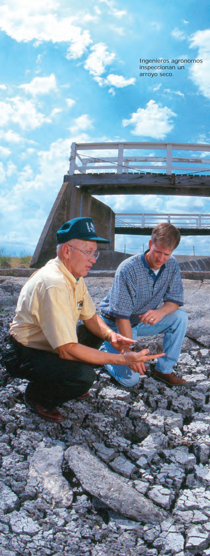
Ingenieros agrónomos inspeccionan un arroyo seco.