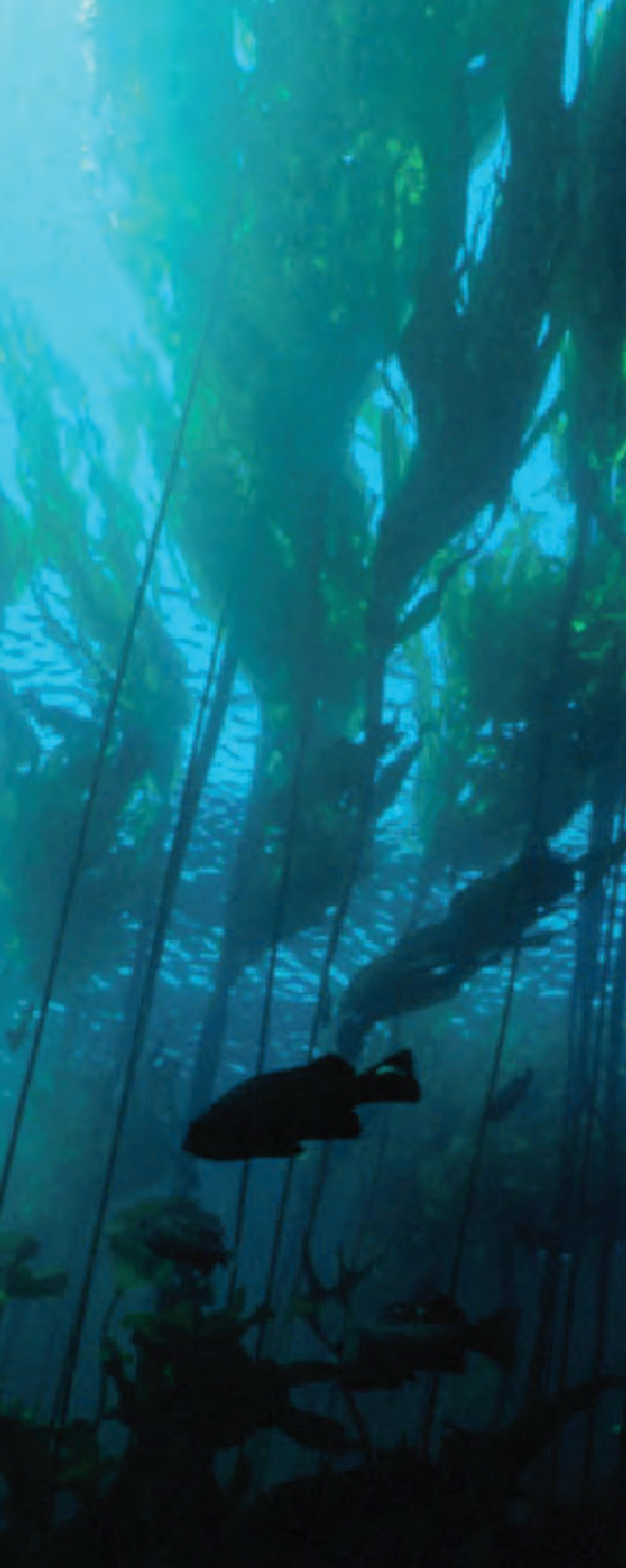
Los bosques de algas marinas y sus comunidades asociadas de organismos se encuentran en las aguas frías más allá de la costa de California.