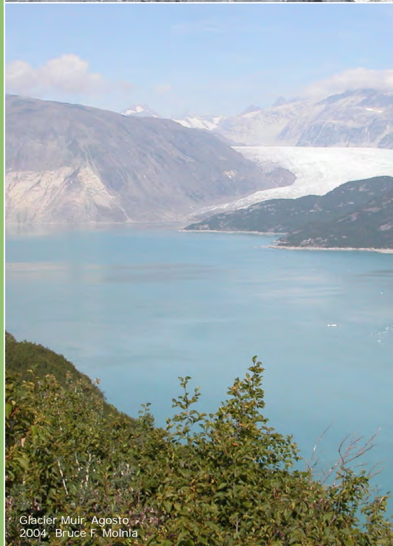
Glaciar Muir, Agosto 2004, Bruce F. Molnia