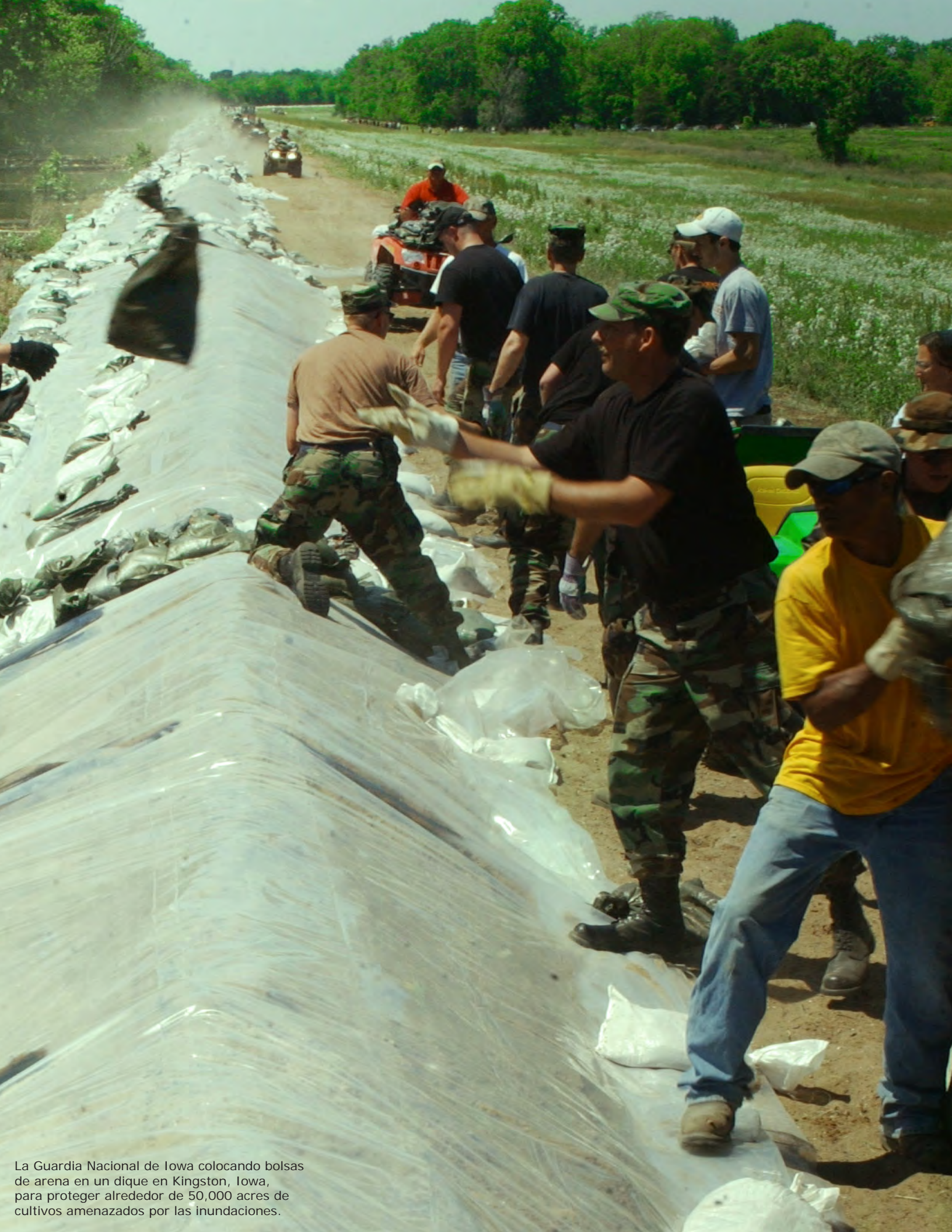
La Guardia Nacional de Iowa colocando bolsas de arena en un dique en Kingston, Iowa, para proteger alrededor de 50,000 acres de cultivos amenazados por las inundaciones.